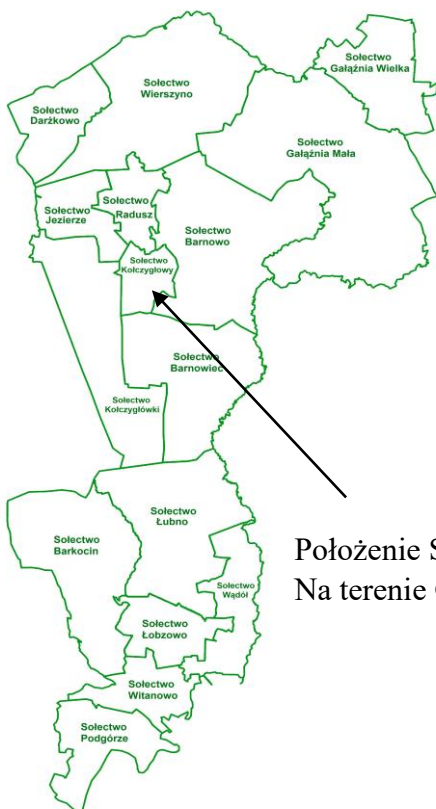
Położenie Sołectwa Kołczygłowy Na terenie Gminy Kołczygłowy