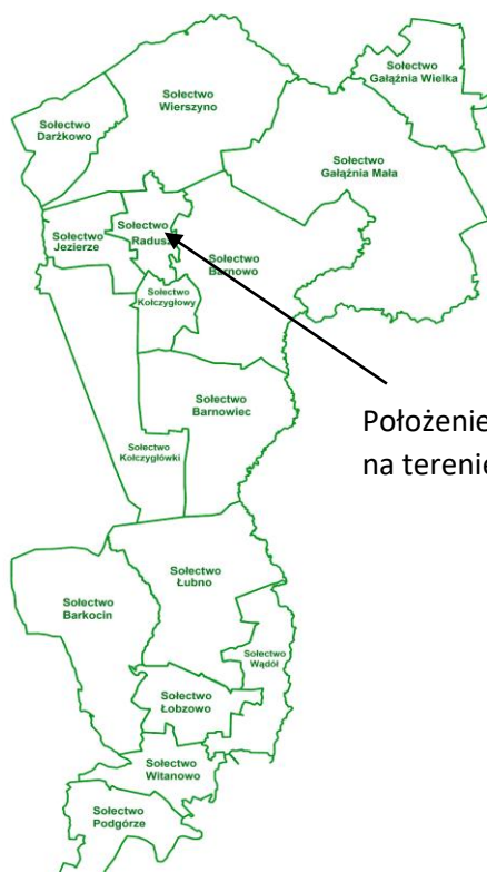
Położenie Sołectwa Radusz na terenie Gminy Kołczygłowy